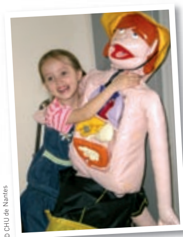
La poupée Lou